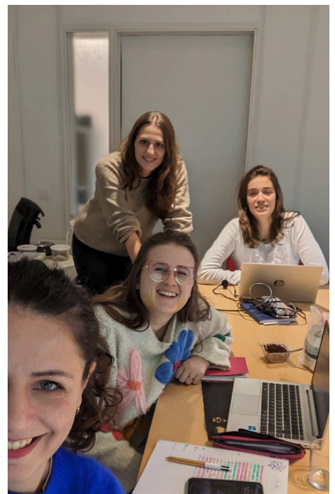
NOTRE GROUPE DE TRAVAIL