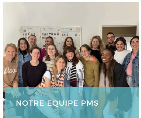
NOTRE EQUIPE PMS